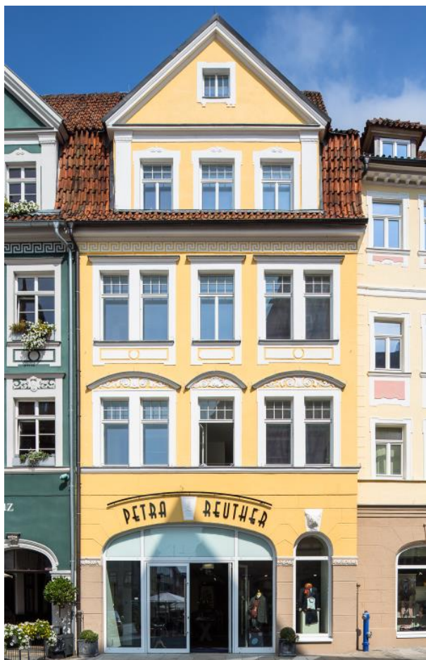
Außenansicht 1. OG links (ca. 68 m 2 )