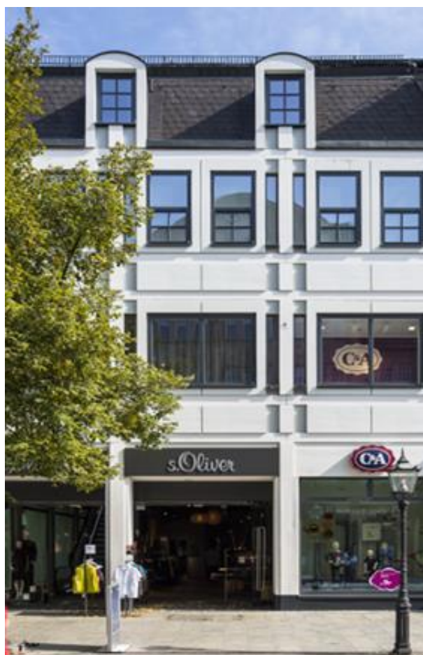
Außenansicht 3. OG rechts (ca. 1.170 m 2 )